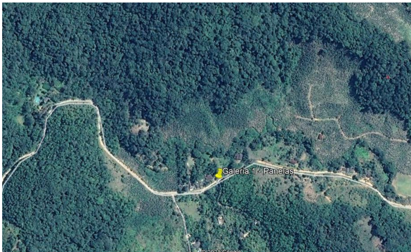
Figura 2 - IMPLANTAÇÃO DE GALERIA EM CURSO DE RIO (GALERIA 01) – BAIRRO PANELAS – MIRACATU - SP

COORDENADAS DE LOCALIZAÇÃO: -24^{\circ}21'6,39605''S , -47^{\circ}29'8,88792''O