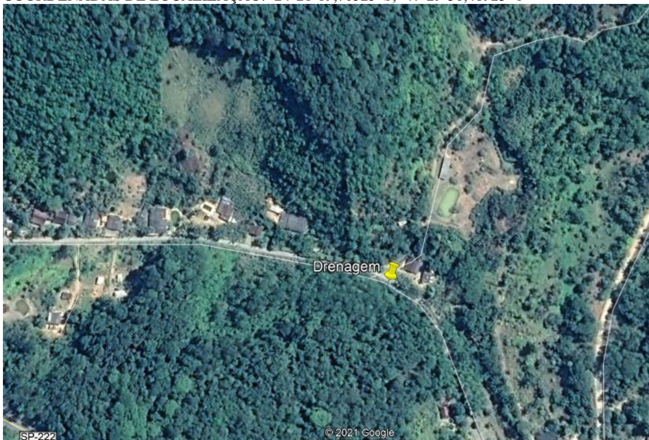
Figura 1 - IMPLANTAÇÃO DE DRENAGEM DE ENCOSTA NA ESTRADA DAS PANELAS – BAIRRO PANELAS – MIRACATU - SP

COORDENADAS DE LOCALIZAÇÃO: -24°21'19,70525"S, -47°29'36,48923"O