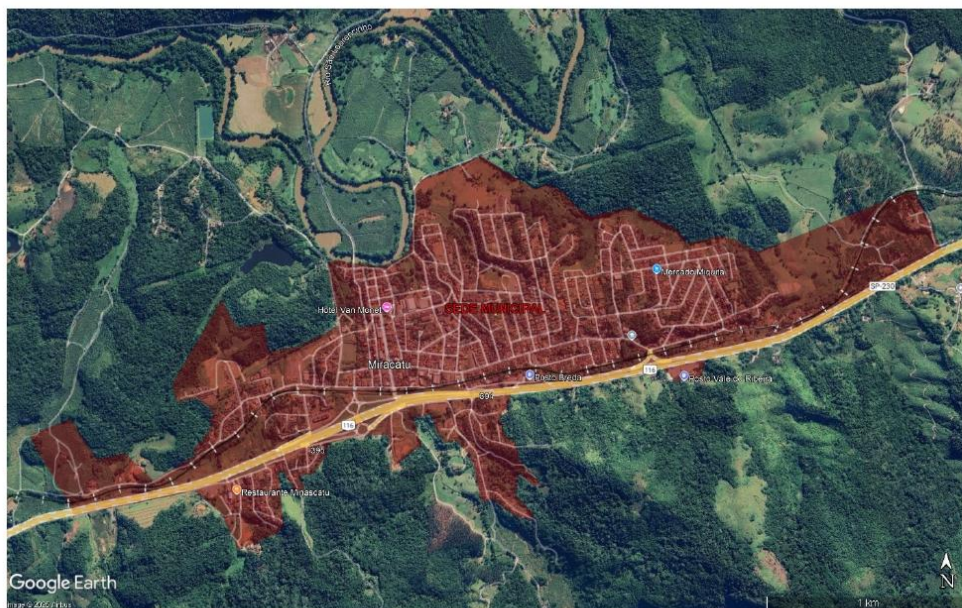
Figura 3 - Recorte da área de onde serão realizados os levantamentos topográficos, representada pela mancha vermelha.

A Figura 3 ilustra a área considerada para o levantamento topográfico, com uma extensão total de 3,61 quilômetros quadrados.