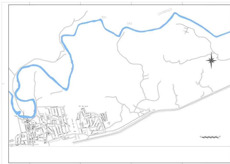
Figura 4 - Recorte da área de onde serão realizados os levantamentos batimétricos, representada pela mancha azul.

A Figura 4 ilustra o trecho que considerado para o levantamento batimétrico, com 8 km de extensão ao longo do Rio São Lourenço, tendo início no ponto com coordenadas: Latitude 24°16'33.47"S, Longitude 47°27'47.88"O.