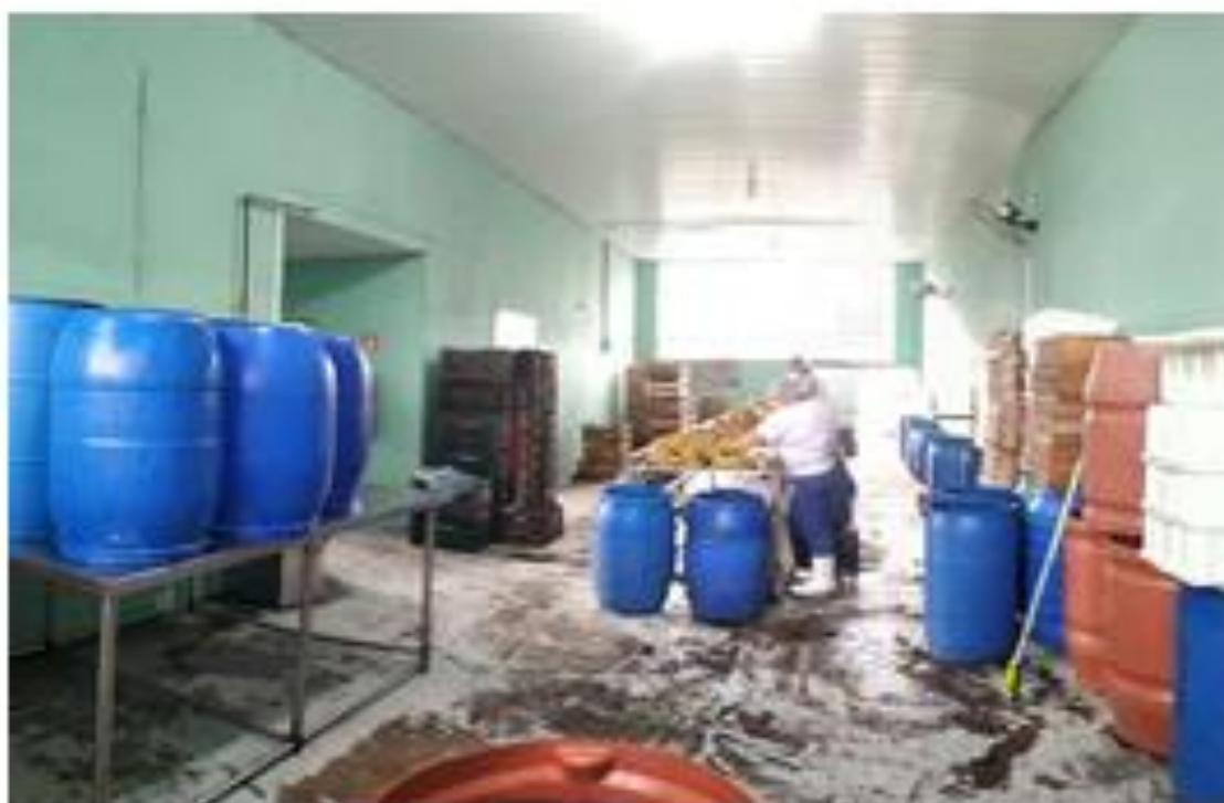
Fotografia: Área de descasque

Assinado por 2 pessoas: HERLY CARVALHO COSTA e VINICIUS BRANDAO DE QUEIROZ Para verificar a validade das assinaturas, acesse https://miracatu.1doc.com.br/verificacao/45D4-0032-E1EC-6642 e informe o código 45D4-0032-E1EC-6642