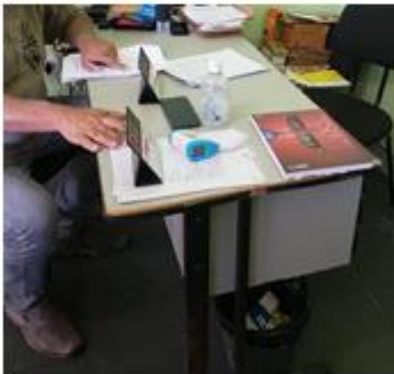
Fotografia: Mesa escritório 1 60cmx50cm

CEP 11850-000 - Telefone: (13) 3847-7000 ramal 207/208