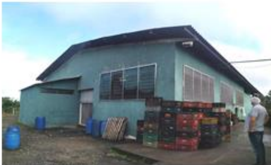
Fotografia: Acesso lateral 2

Assinado por 2 pessoas: HERLY CARVALHO COSTA e VINICIUS BRANDAO DE QUEIROZ Para verificar a validade das assinaturas, acesse https://miracatu.1doc.com.br/verificacao/45D4-0032-E1EC-6642 e informe o código 45D4-0032-E1EC-6642