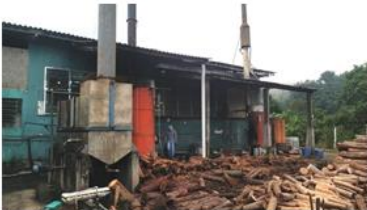
Fotografia: Área da madeira

CEP 11850-000 - Telefone: (13) 3847-7000 ramal 207/208