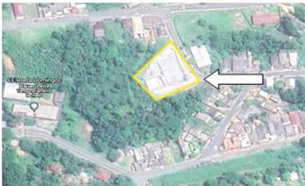
Localização do imóvel