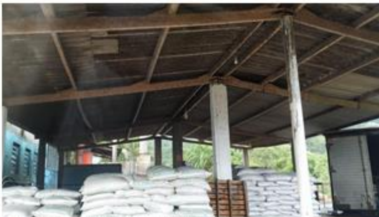
Fotografia: Barracão de armazenamento de material humano

Assinado por 2 pessoas: HERLY CARVALHO COSTA e VINICIUS BRANDAO DE QUEIROZ Para verificar a validade das assinaturas, acesse https://miracatu.1doc.com.br/verificacao/45D4-0032-E1EC-6642 e informe o código 45D4-0032-E1EC-6642