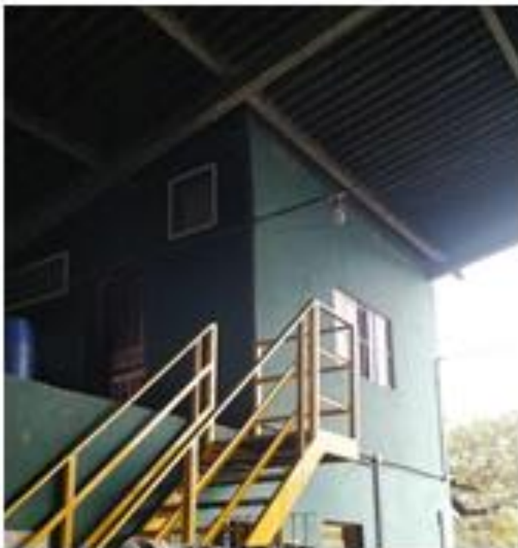
Fotografia: Anexo superior

CEP 11850-000 - Telefone: (13) 3847-7000 ramal 207/208