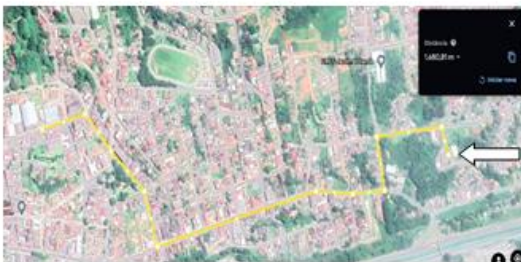
Distância do imóvel até o centro do Município