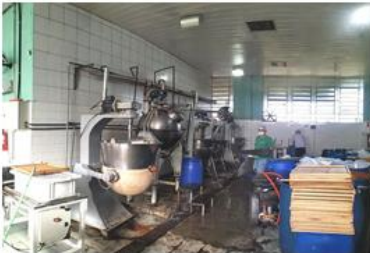
Fotografia: Área de produção

CEP 11850-000 - Telefone: (13) 3847-7000 ramal 207/208