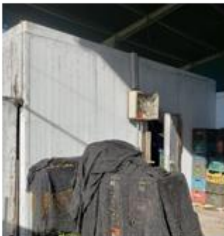
Fotografia: Câmara frigorífica

Assinado por 2 pessoas: HERLY CARVALHO COSTA e VINICIUS BRANDAO DE QUEIROZ Para verificar a validade das assinaturas, acesse https://miracatu.1doc.com.br/verificacao/45D4-0032-E1EC-6642 e informe o código 45D4-0032-E1EC-6642