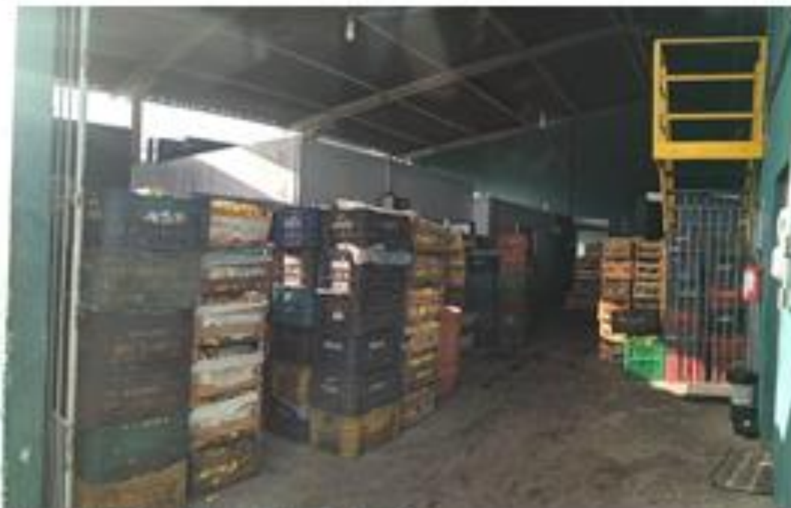
Fotografia: Recepção de carga área frigorífico

CEP 11850-000 - Telefone: (13) 3847-7000 ramal 207/208