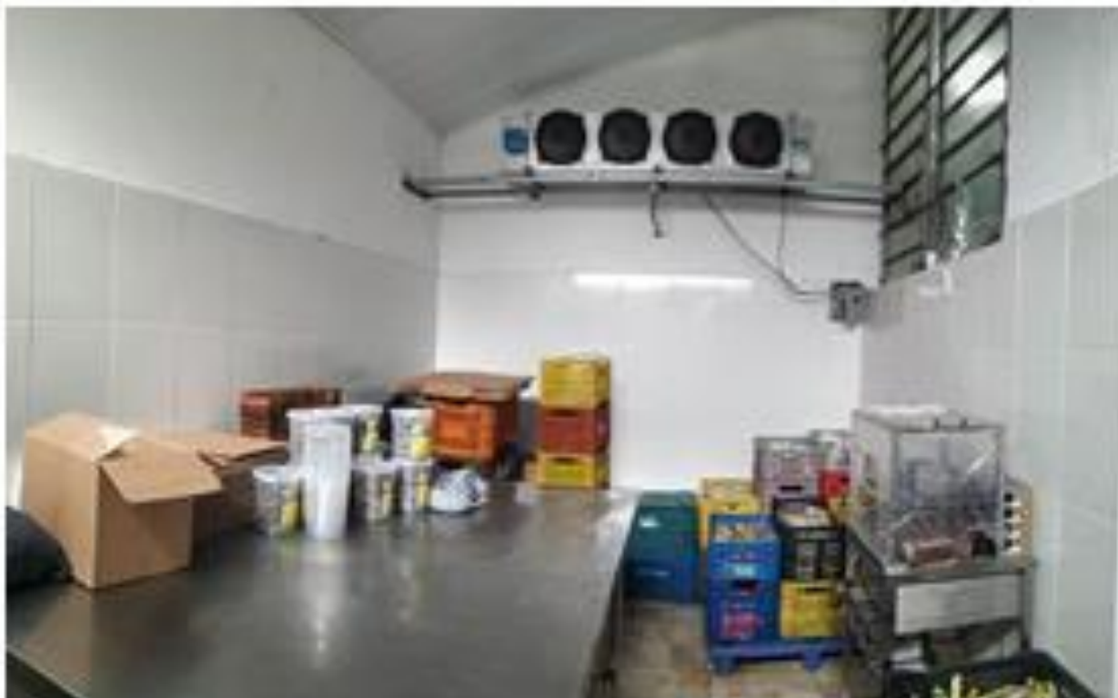
Fotografia: Área de embalagem/refrigeração

CEP 11850-000 - Telefone: (13) 3847-7000 ramal 207/208