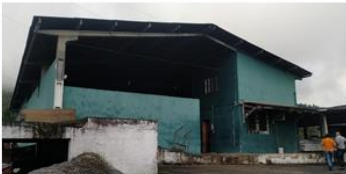
Fotografia: Acesso lateral 01 - carga/descarga

Assinado por 2 pessoas: HERLY CARVALHO COSTA e VINICIUS BRANDAO DE QUEIROZ Para verificar a validade das assinaturas, acesse https://miracatu.1doc.com.br/verificacao/45D4-0032-E1EC-6642 e informe o código 45D4-0032-E1EC-6642