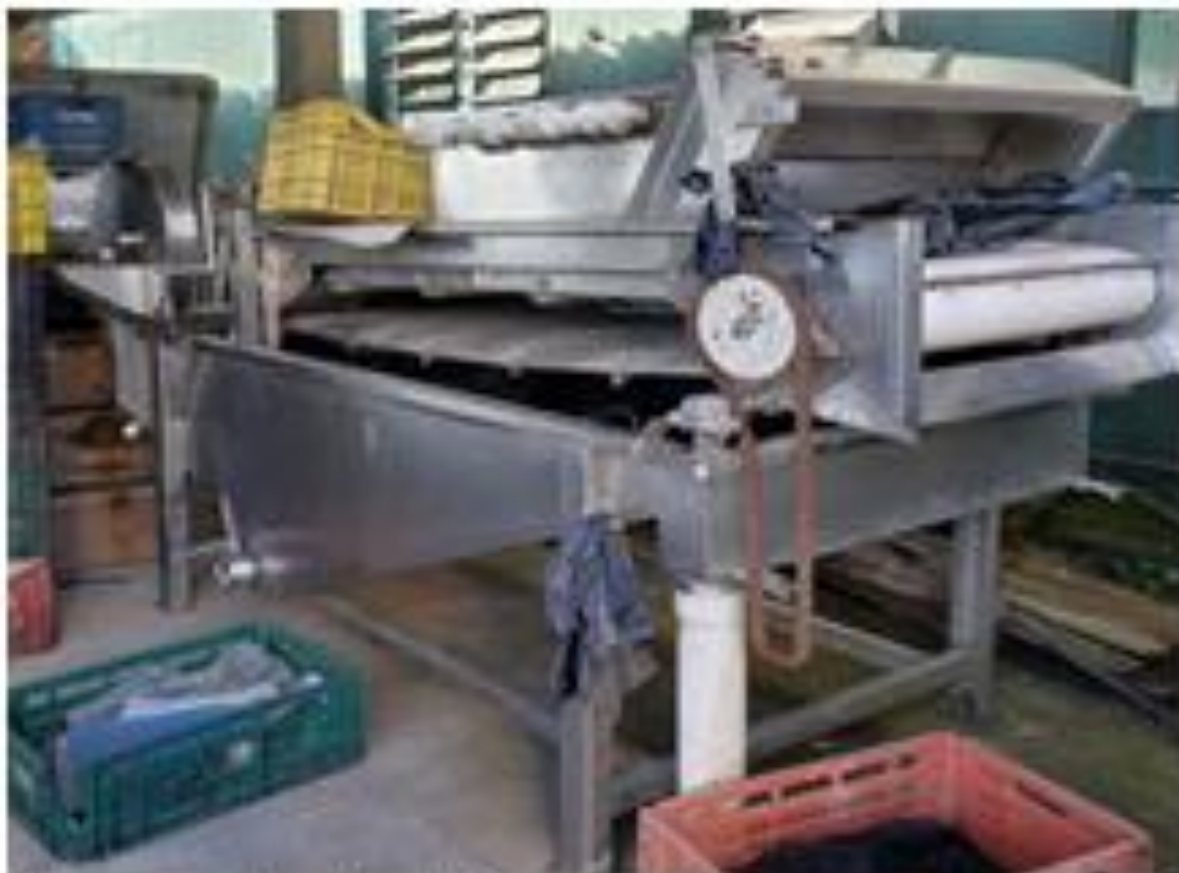
Fotografia: Lavadora de frutas

CEP 11850-000 - Telefone: (13) 3847-7000 ramal 207/208