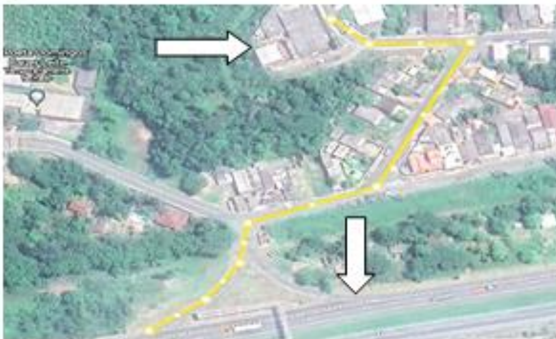
Distância do imóvel até a Rodovia Regia Bittencourt - BR-116 (sem escala)

CEP 11850-000 - Telefone: (13) 3847-7000 ramal 207/208