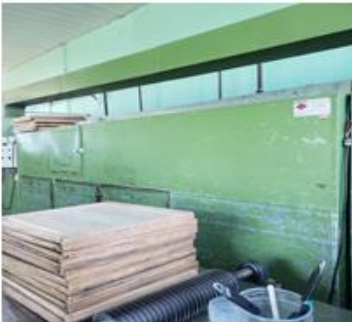
Fotografia: Secador de banana

CEP 11850-000 - Telefone: (13) 3847-7000 ramal 207/208