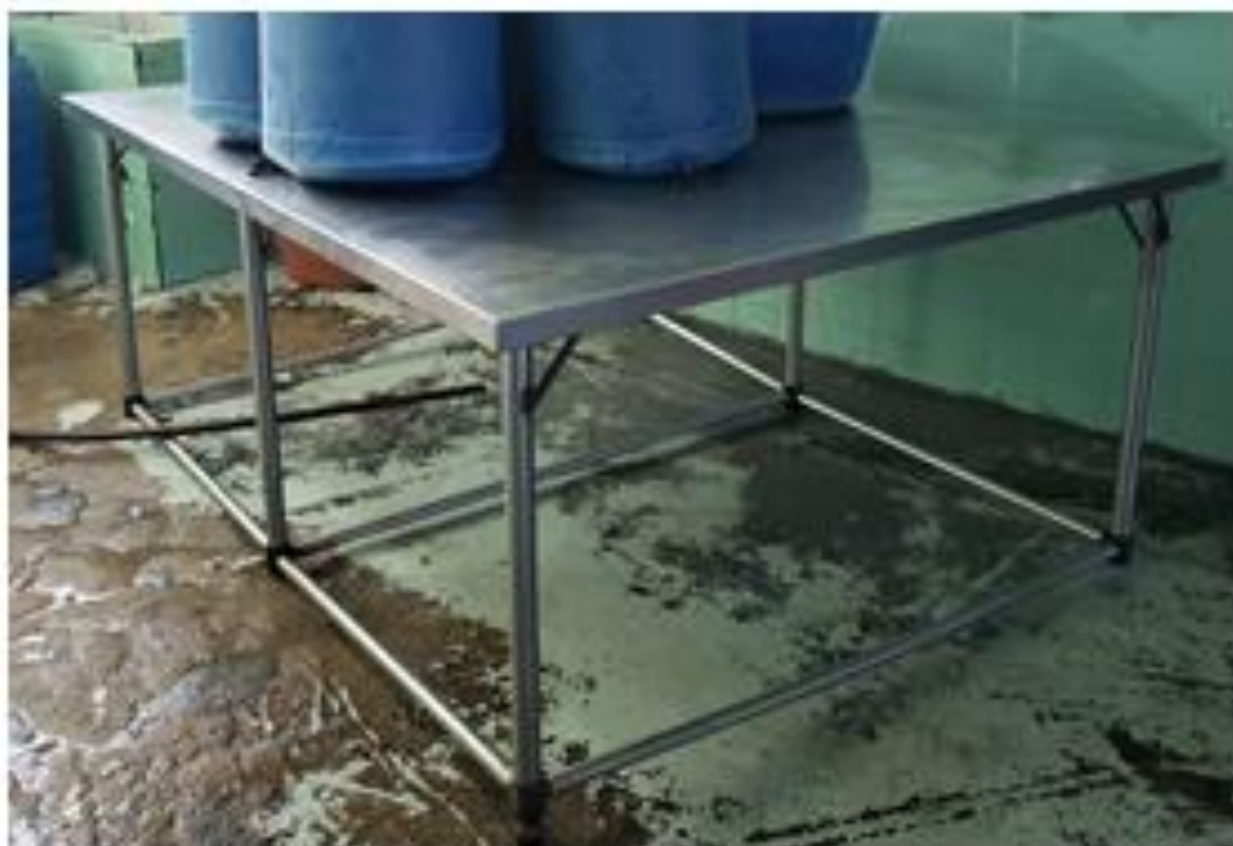
Fotografia: Mesa de inox

Assinado por 2 pessoas: HERLY CARVALHO COSTA e VINICIUS BRANDAO DE QUEIROZ Para verificar a validade das assinaturas, acesse https://miracatu.1doc.com.br/verificacao/45D4-0032-E1EC-6642 e informe o código 45D4-0032-E1EC-6642