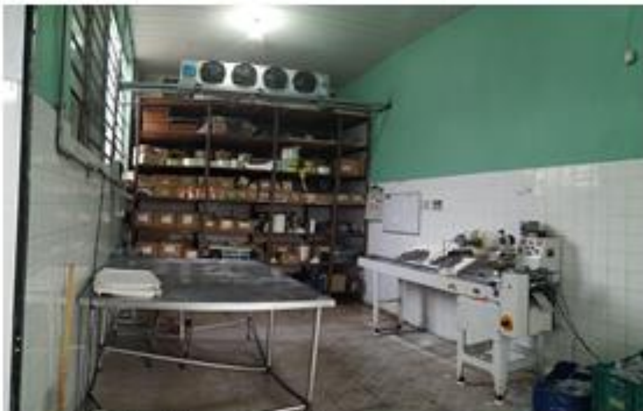
Fotografia: Área de embalagem/refrigeração

Assinado por 2 pessoas: HERLY CARVALHO COSTA e VINICIUS BRANDAO DE QUEIROZ Para verificar a validade das assinaturas, acesse https://miracatu.1doc.com.br/verificacao/45D4-0032-E1EC-6642 e informe o código 45D4-0032-E1EC-6642