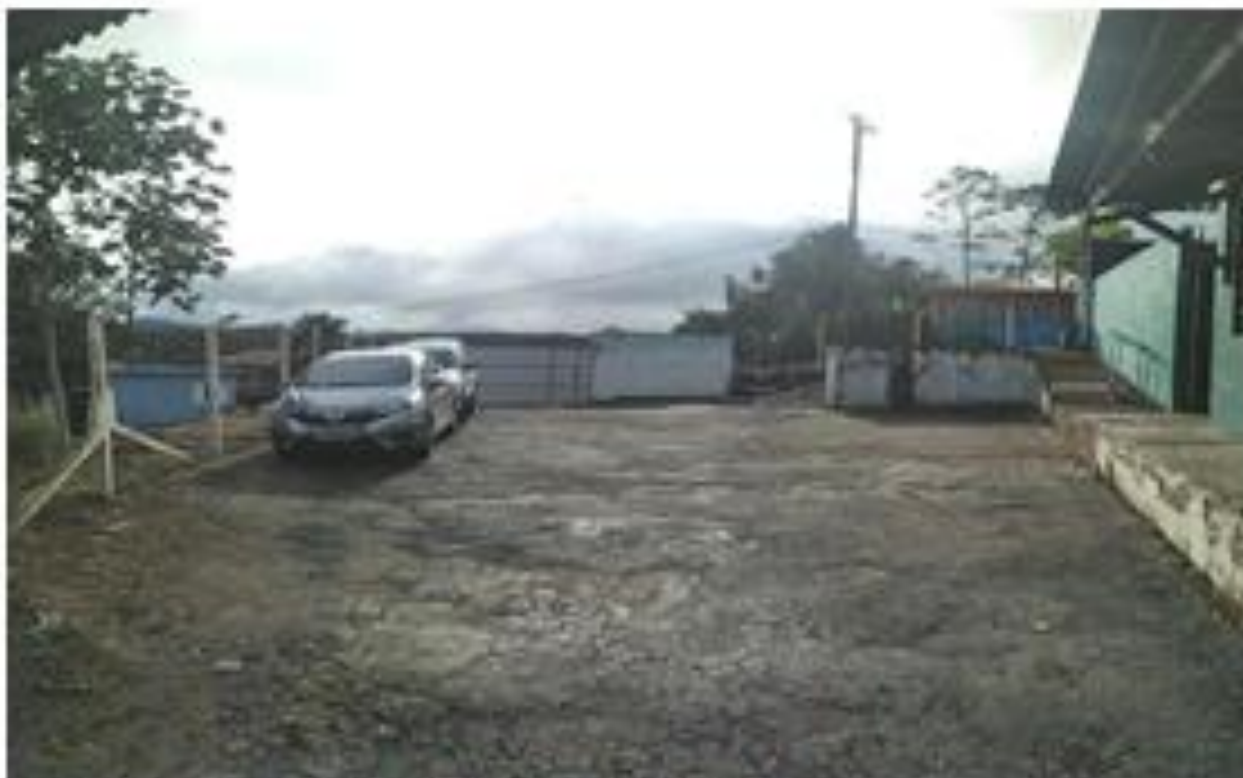
Fotografia: Pátio entrada e estacionamento/carga/descarga

Assinado por 2 pessoas: HERLY CARVALHO COSTA e VINICIUS BRANDAO DE QUEIROZ Para verificar a validade das assinaturas, acesse https://miracatu.1doc.com.br/verificacao/45D4-0032-E1EC-6642 e informe o código 45D4-0032-E1EC-6642