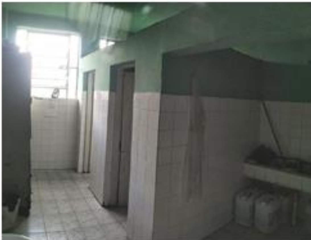
Fotografia: Banheiro masculino

CEP 11850-000 - Telefone: (13) 3847-7000 ramal 207/208