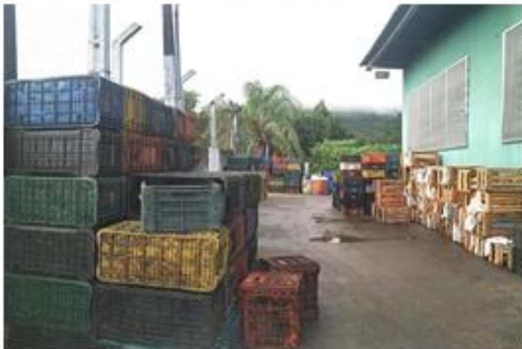
Fotografia: Área de armazenamento de caixas