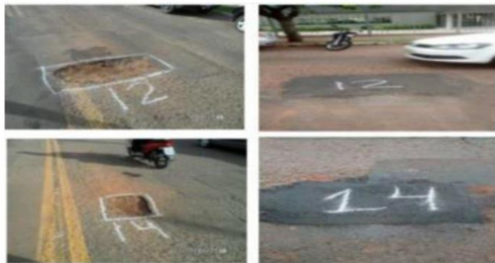
Figura 2: Exemplo de relatório fotográfico