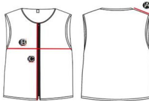
TABELA DE MEDIDAS: