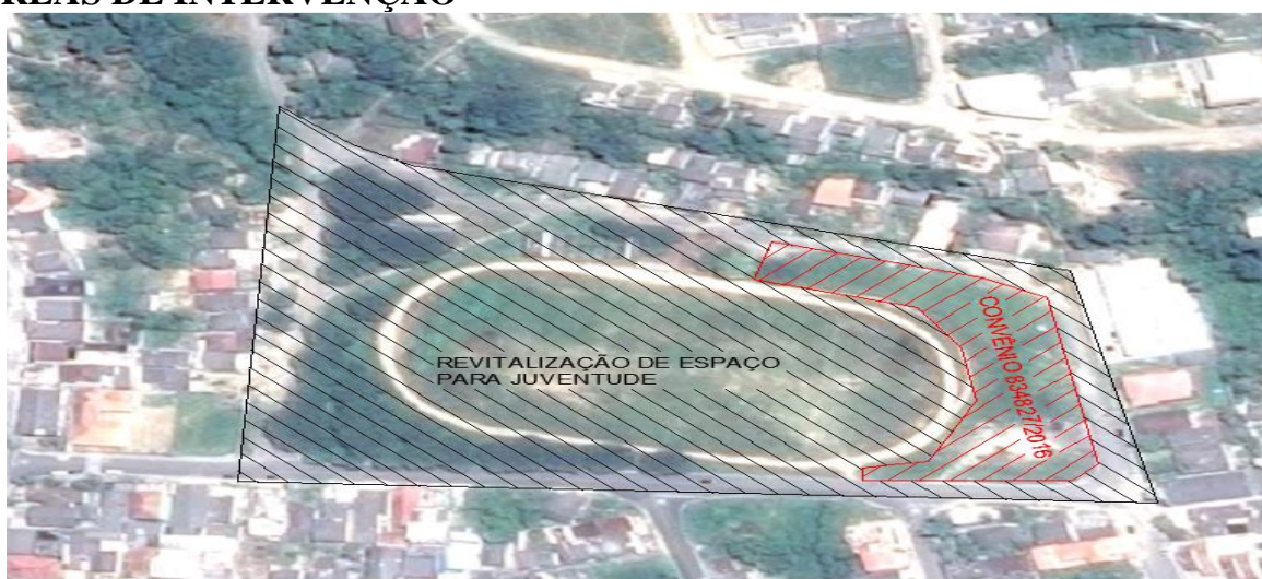
Figura 01 – Área de intervenção