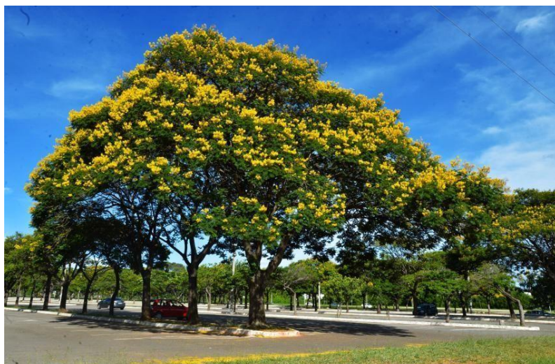
ÁRVORE ORNAMENTAL DO TIPO SIBIPIRUNA Quantidade: 02 unidades.

Para o preparo do berço do plantio deverá ser feita a correção do solo com aplicação de 150g de calcário, 150g de 04-14-08 e 75 quilos de substrato.