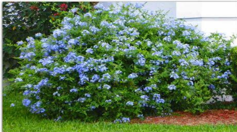
ARBUSTO FLOR BELA EMÍLIA – H: 1,00 METRO

Para o preparo do berço do plantio deverá ser feita a correção do solo com aplicação de 15g de calcário, 15g de 04-14-08 e 1 quilo de substrato, em cada berço.