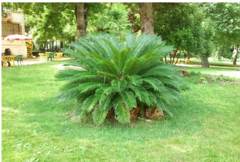
ARBUSTO CICA Quantidade: 12 unidades

Para o preparo do berço do plantio deverá ser feita a correção do solo com aplicação de 15g de calcário, 15g de 04-14-08 e 1 quilo de substrato, em cada berço.