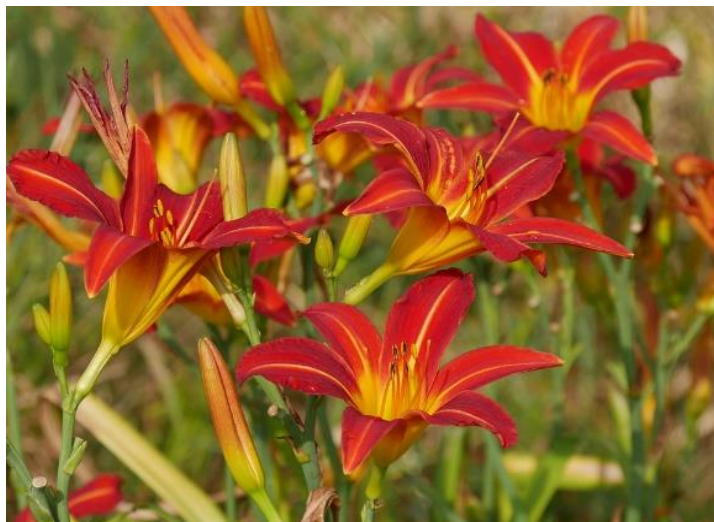
FORRAÇÃO COM LÍRIO DO CAMPO AMARELO Quantidade: 25,80m 2

Para o preparo do berço do plantio deverá ser feita a correção do solo com aplicação de 15g de calcário, 15g de 04-14-08 e 1 quilo de substrato, em cada berço.