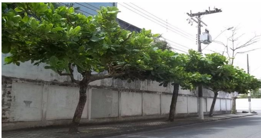
ÁRVORE ORNAMENTAL DO TIPO CHAPÉU DE SOL

Para o preparo do berço do plantio deverá ser feita a correção do solo com aplicação de 150g de calcário, 150g de 04-14-08 e 75 quilos de substrato.