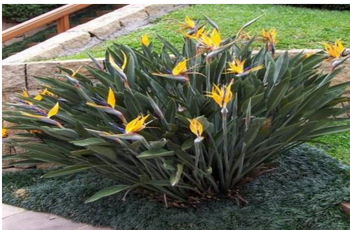
ARBUSTO STRELICIA Quantidade: 03 unidades

Para o preparo do berço do plantio deverá ser feita a correção do solo com aplicação de 15g de calcário, 15g de 04-14-08 e 1 quilo de substrato, em cada berço.